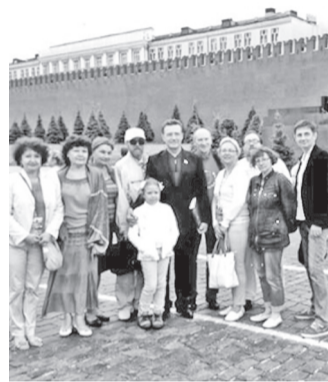
Читателям, писателям и книгам вход на Красную площадь - свободный. Литературный Ульяновск на фоне Спасской башни

Люди шли на Красную площадь, невзирая на дождь. Многочисленных иностранцев главная площадь страны на этот раз встречала не парадом военной техники, и не масленичными гуляньями с блинами и медовухой, а чтением стихов и театральными постановками. Москвичи, похоже, не ожидали услышать столько талантливых авторов из российских глубин, увидеть такое количество уникальных изданий, приобрести их напрямую у издательств по ценам ниже, чем в столичных магазинах. стр. 8